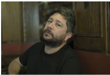
Sebastián Vidal Campos Regisseur von Al sur del invierno está la nieve

Tübingen: Do, 23. April – So, 26. April Stuttgart: Sa, 25. April