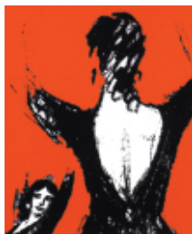
Zeichnung von Carlos Saura für Carmen