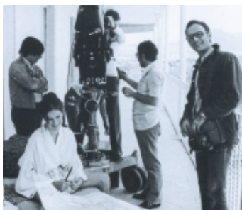
1968 bei den Dreharbeiten für Ana y los lobos